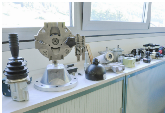
Bei uns haben Sie die Möglichkeit, Pumpen und Ventile in Einzelteilen zu betrachten.